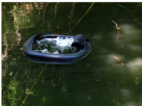
Bild 2. AQUAkon/GOLF ® gesunde Biologie, geringeres Algen- und Wasserpflanzenwachstum, verbesserte Wasserqualität