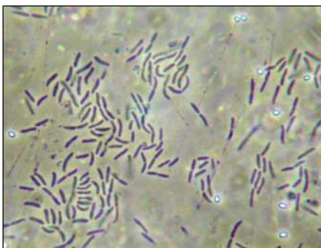
Bild 1. AQUAkon1 ® Mikroskopische Aufnahme der mikrobiellen Mischkultur