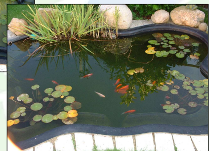
Bild 2. AQUAkon1 ® Verbesserung der Wasser- qualität in einem Biotop